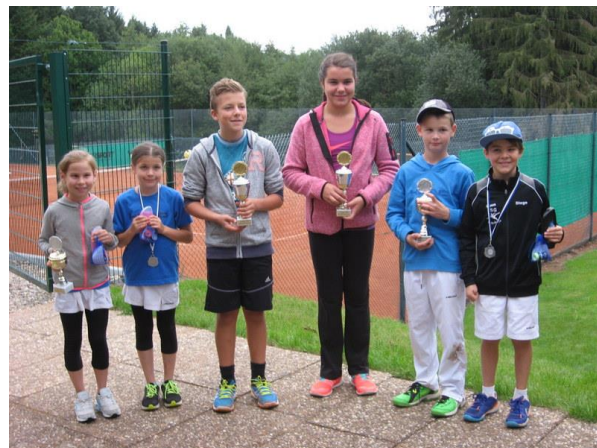
Sieger und Siegerinnen des 1. Ulstertaler –Kinder-Cups

kanntgegeben. Wir wünschen allen Spielerinnen und Spielern eine erfolgreiche Saison mit spannenden Begegnungen, ohne Verletzungspech und Abstiegssorgen.