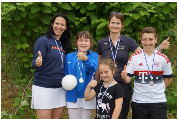
Siegermannschaft Pfingstturnier 2017