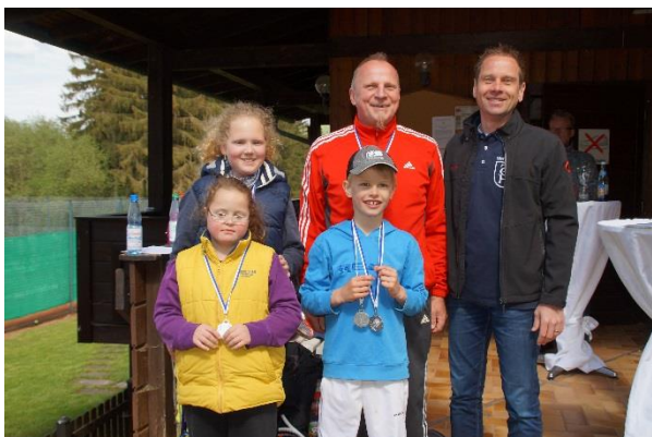
Siegermannschaft des Pflingsturniers 2016

Die 1. Herrenmannschaft erkämpfte sich Platz 2 in der Kreisliga A.