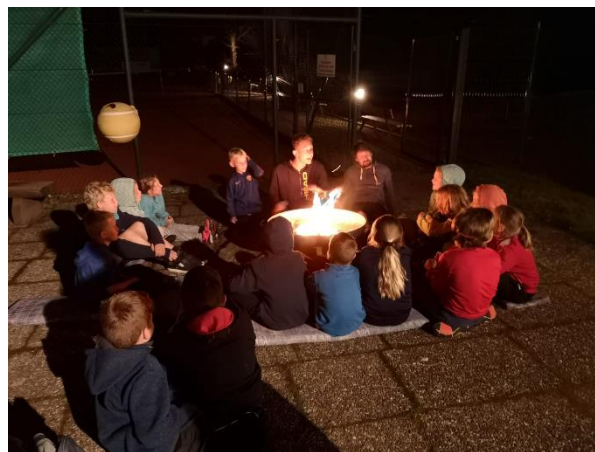
Jugendvereinsmeisterschaften und Zeltwochenende

Wichtig: Die Vereinsmeisterschaften werden nur durchgeführt, wenn sich genügend Spieler und Spielerinnen melden. Der Vorstand ist der Ansicht, dass alle Mannschaftsspieler und -spielerinnen nach Möglichkeit an den Jugendvereinsmeisterschaften teilnehmen sollten.